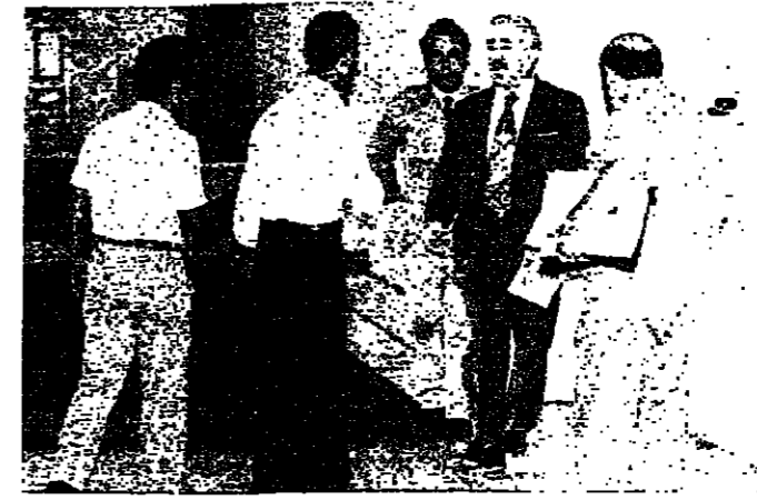
الرئيس كرامي لدى مغادرته مكتبه في السراي، ويبدو بجانبه المرشحون

تقرر ايجاد بئنة ندية الى المملكة العربية السعودية، في مهمة تتعلق بتسوية مشاكله المالية بمساعدة سعودية، وستستمر البئنة وهي رزاقية، في مهمة لا تتعدى الاسبوع، وقد كشف عن القرار بعد اجتماع عمل عقد في السراي، برئاسة الرئيس كرامي، وحضور مدير عام الإسكان السيد فؤاد ديبان، ومدير عام وزارة التصميم العام السيد زكي شامي، والسيد عصام عاشور، ورئيس مجلس تنفيذ المشاريع الكبرى السيد ياسي شاما، ومدير عام وزارة الصحة بالوكالة